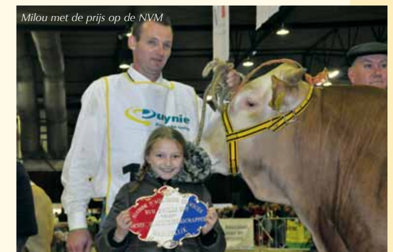
Milou met de prijs op de NVM