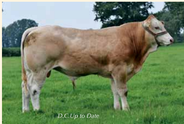
D.C. Up to Date