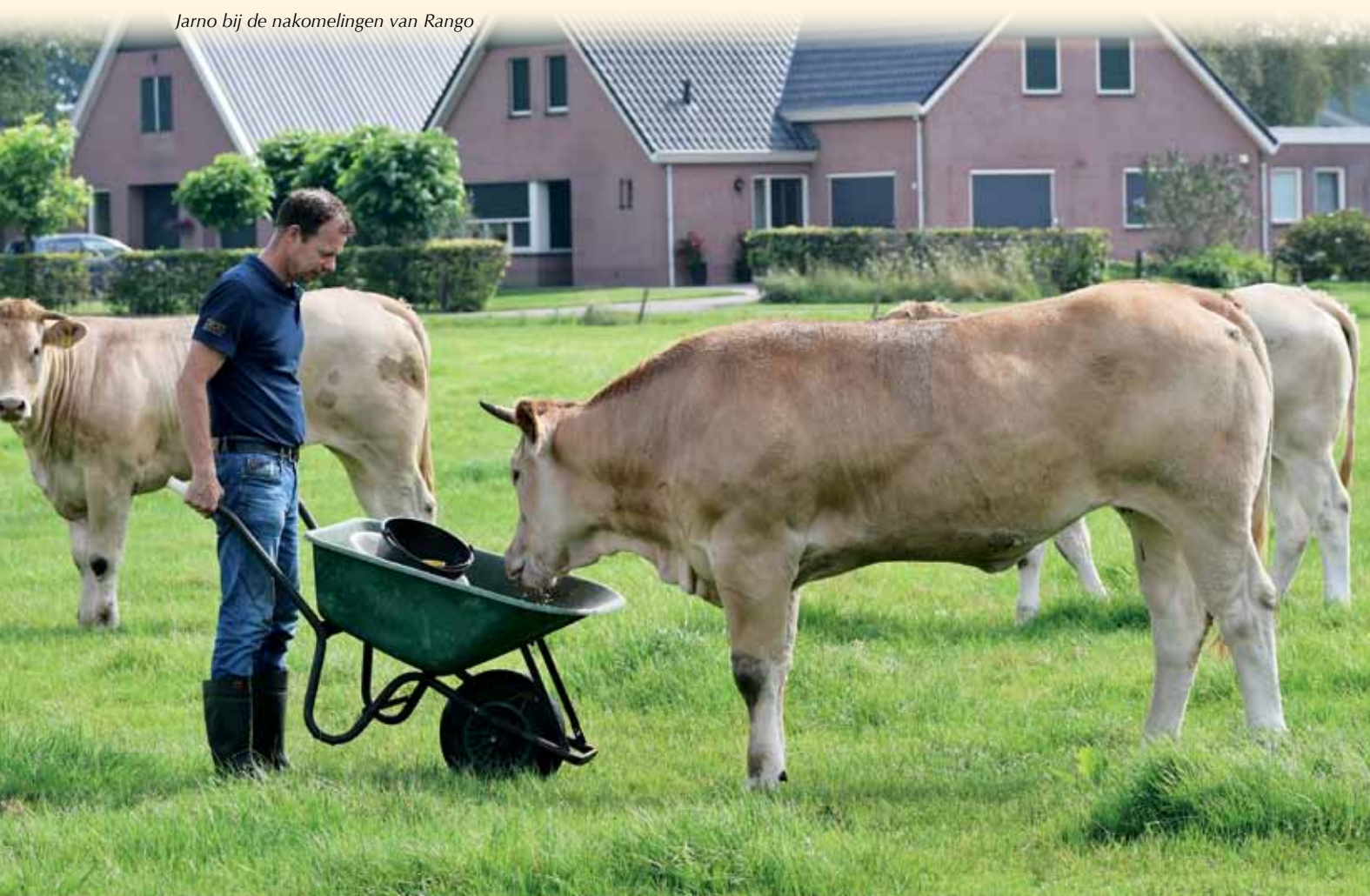
Jarno bij de nakomelingen van Rango

GERARD VAN KOOLWIJK TEL. 06-51330035 G.VANKOOLWIJK@VITWENTE.NL